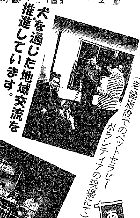
(老健施設でのボランティア活動の現場など)